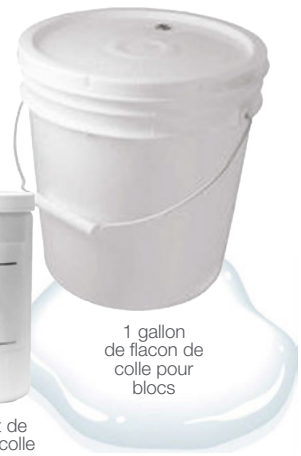
1 gallon de flacon de colle pour blocs