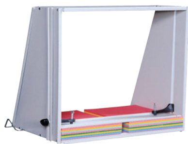
J1824 Jiffy Giant