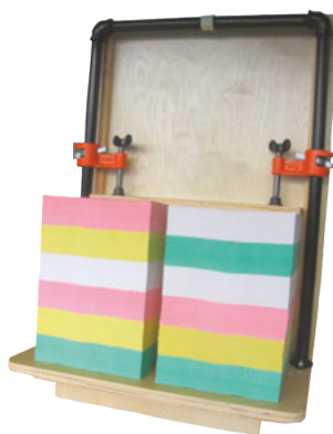
W175 Ultra II